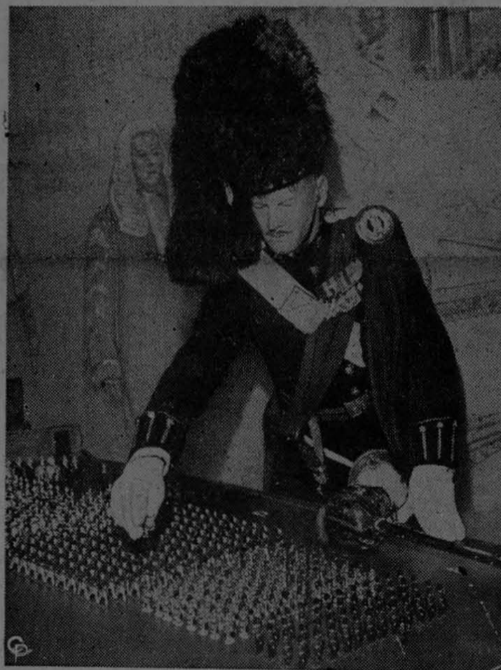
El Mayor Claud MacBeth Moir del regimiento de la Guardia Negra, de los Reales Highlanders, coloca regimientos de soldados de juguete en Nueva York al anunciar los planes para un recorrido por 55 ciudades norteamericanas. En el mismo figurarán 100 músicos de la banda con sus sombreros de piel de oso para mostrar gaitas y bailes de su tierra natal Escocia. El recorrido cubrirá unas 11 semanas.